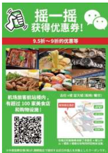
【ホテル内ポスター例】