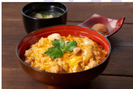
三和の純鶏名古屋コーチン親子丼