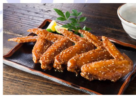
三和の純鶏名古屋コーチン手羽唐

こうじを加えて、柔らかくジューシーに仕上げた鶏専門店の唐揚を2種類お楽しみいただける定食