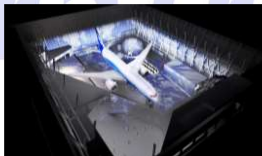
（仮称）超体感演出 イメージ