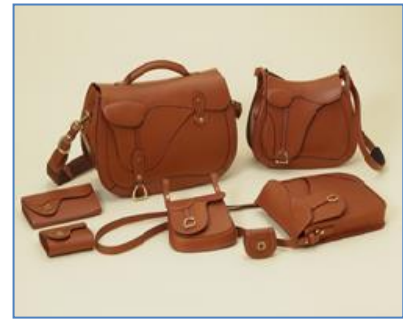
③鞆いたがき【革製品】