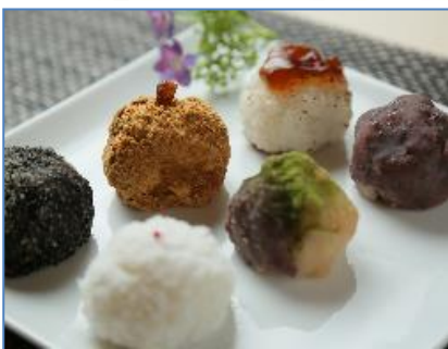
① OHAGI3 【おはぎ】