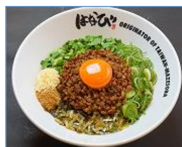
⑤麺屋はなび【台湾まぜそば】