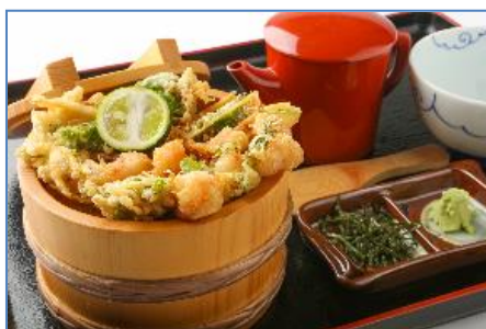
④下の一色 【天ぷら・天丼】