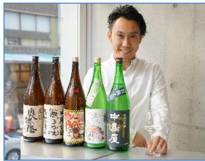
②純米酒専門 YATA 【日本酒】