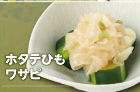
ホタテひも ワサビ