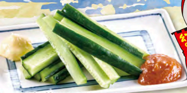
味噌マヨキュー 460円(税込506円)