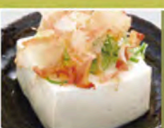
冷やっこ 330円(税込363円)