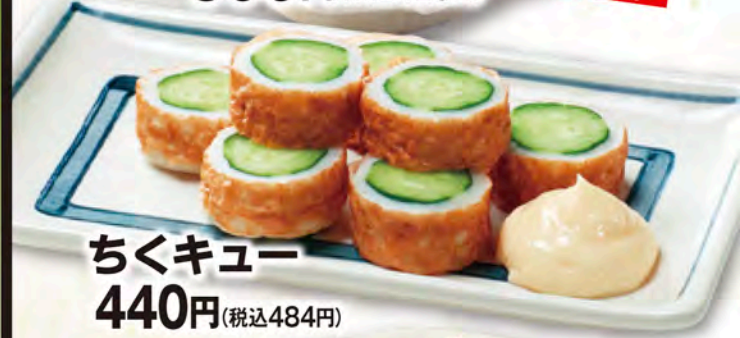
ちくキュー 440円(税込484円)