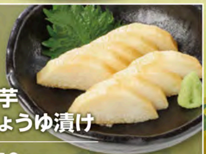
長芋 しょうゆ漬け 450円(税込495円)