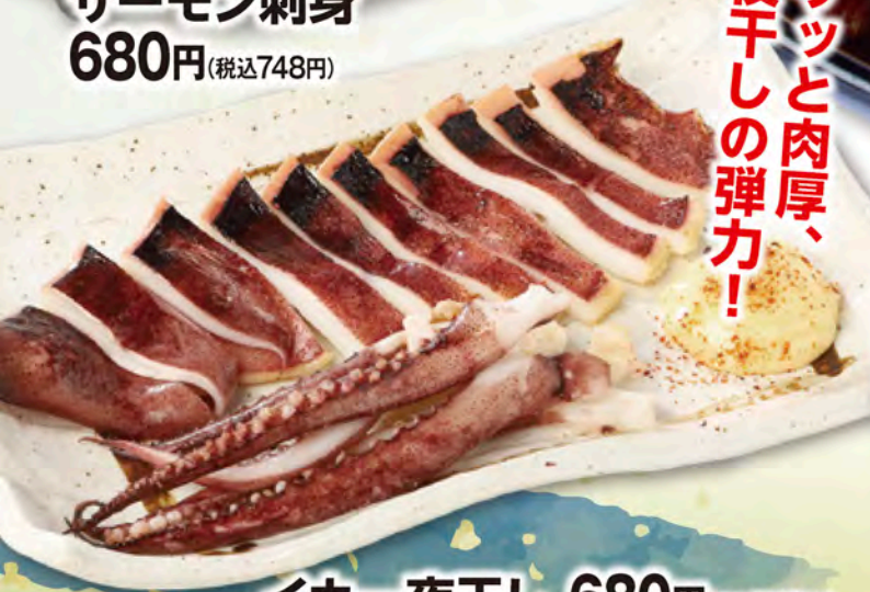
イカ一夜干し 680円(税込748円)