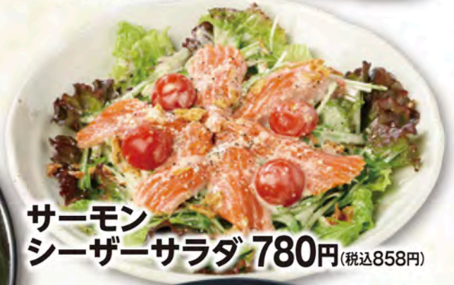
サーモン シーザーサラダ 780円(税込858円)