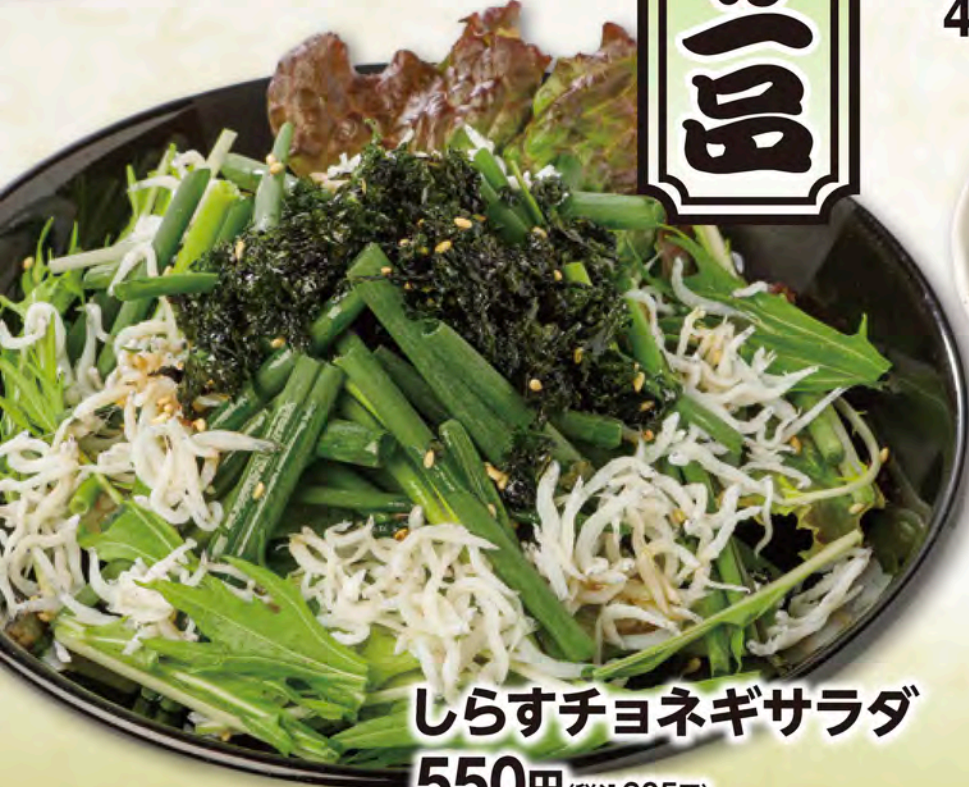
しらすチョネギサラダ 550円(税込605円)