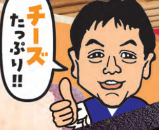
追いせん 5枚 110円 (税込121円)