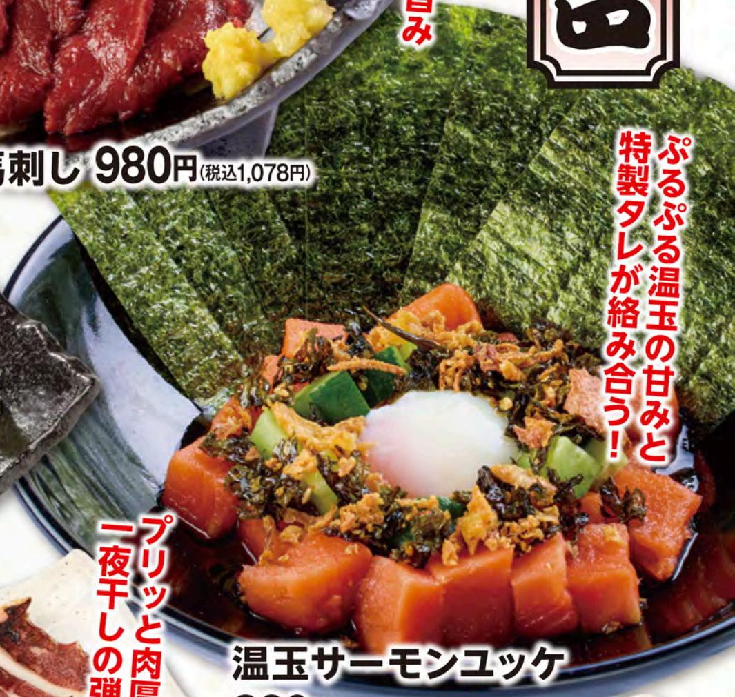
温玉サーモンユッケ 830円(税込913円)