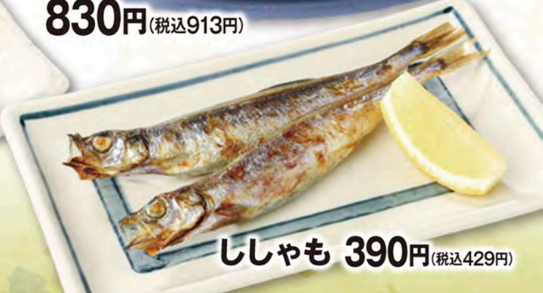
ししゃも 390円(税込429円)