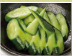
きゅうり漬け 390円(税込429円)