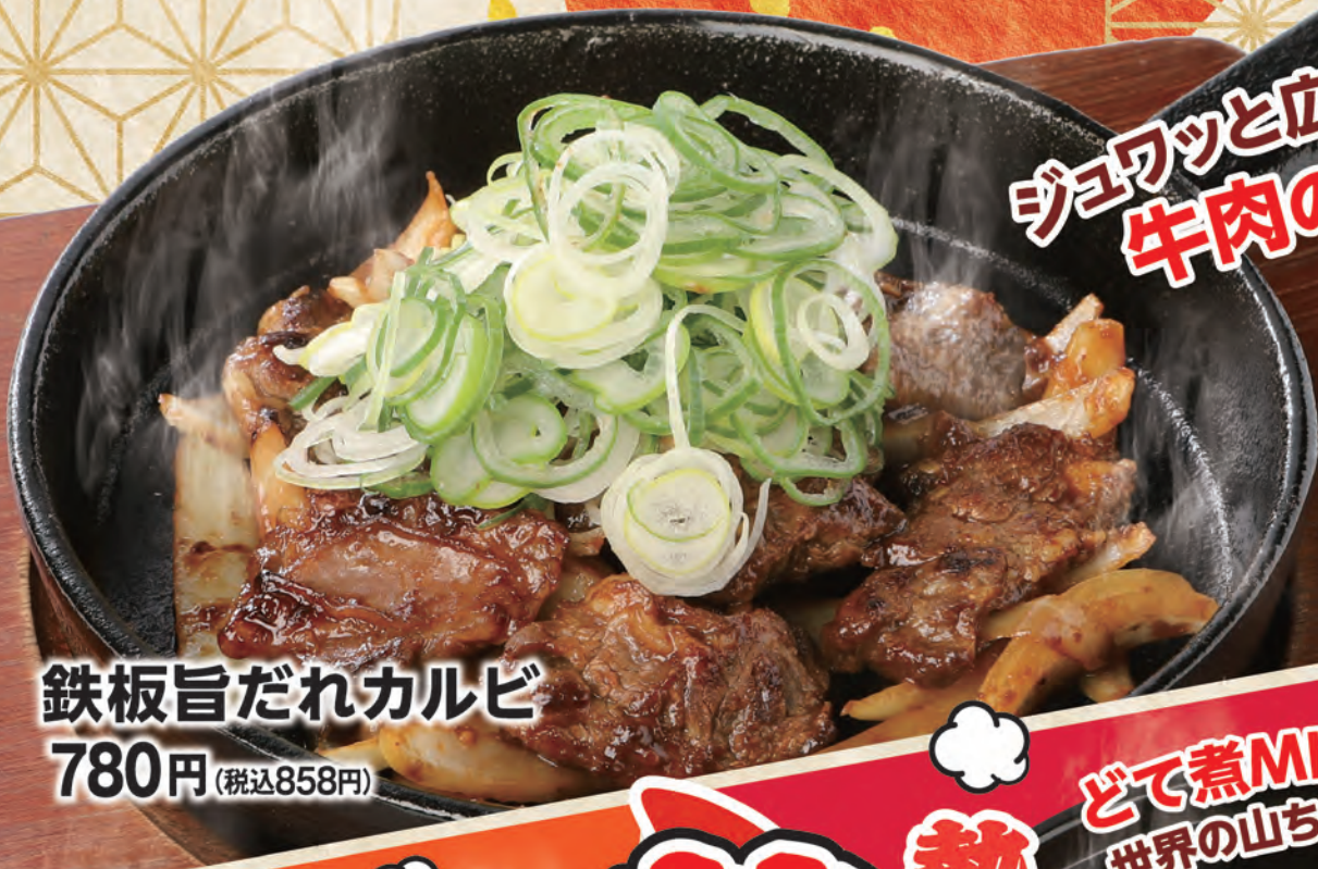
鉄板旨だれカルビ 780円 (税込858円)