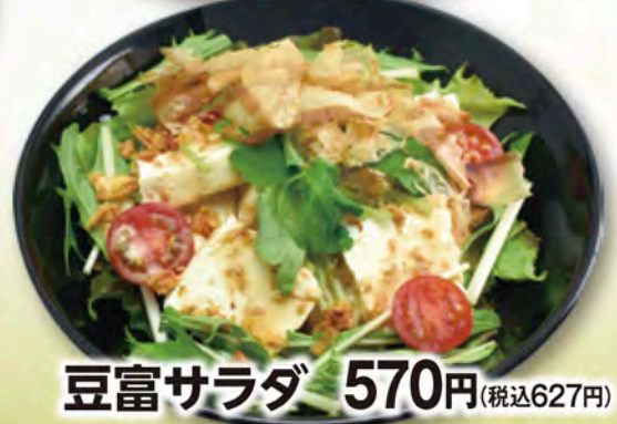
豆腐サラダ 570円(税込627円)