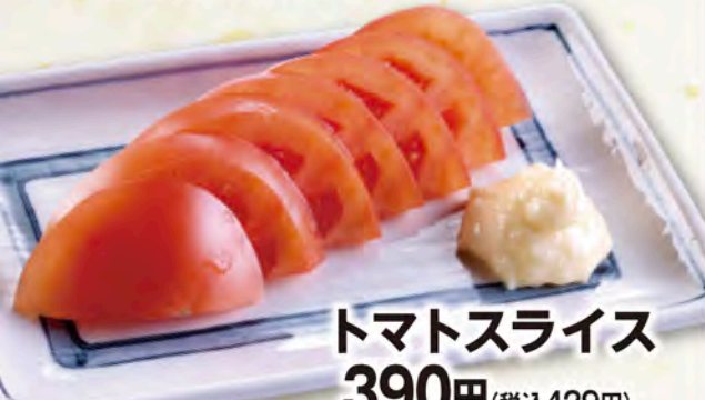
トマトスライス 390円(税込429円)