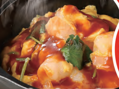
プリプリえび玉 680円 (税込748円)