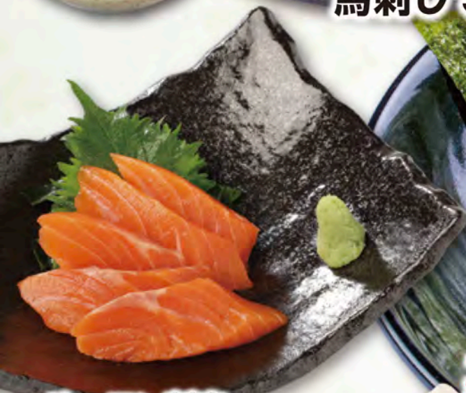
サーモン刺身 680円(税込748円)