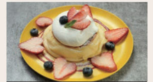
ストロベリー&クリーム ¥680 (Strawberry & Cream) (¥748)