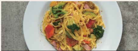
真沢山ペペロンチーノ ¥990 (Peperoncino) (¥1,089)