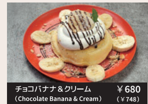
チョコバナナ&クリーム ¥680 (Chocolate Banana & Cream) (¥748)

プラス ¥300 (¥330) で 2 枚に変更が出来ます (You can change it to 2 pieces for an additional ¥330)