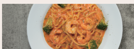
エビとブロッコリーのクリーム ¥1,280 (Prawn & Broccoli Cream) (¥1,408)