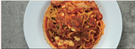
トマト & モッツアレラチーズ ¥1,100 (Tomato & Mozzarella Cheese) (¥1,210)