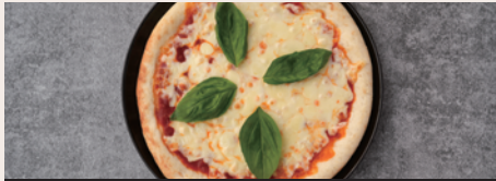
W チーズのマルゲリータ ¥1,280 (Double Cheese Margherita) (¥1,408)