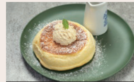
プレーン&メープルバター ¥600 (Plane & Maple Butter) (¥660)