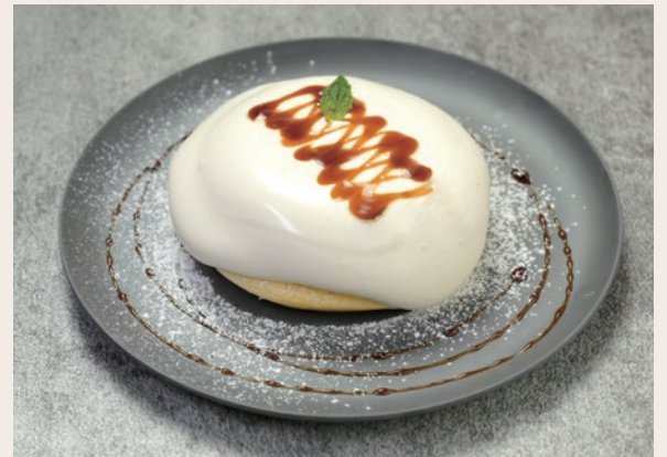
HoiHoi 自家製メープルクリーム ¥650 (HoiHoi Homemade Maple Cream) (¥715)