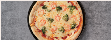
たっぷりエビ & ブロッコリー ¥1,480 (Prawn & Broccoli) (¥1,628)