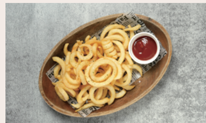
カーリーポテトフライ ¥780 (Curly French Fries) (¥858)