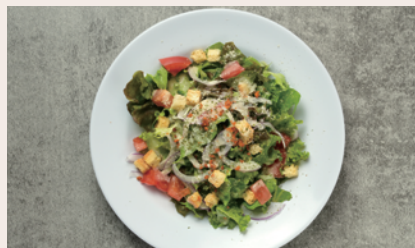
シーザーサラダ ¥780 (Caesar Salada) (¥858)