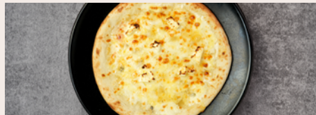
クワトロフォルマッジ ¥1,580 (Quattro Formaggi) (¥1,738)