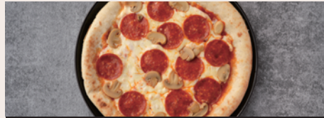
ペパロニサラミ&マッシュルーム ¥1,380 (Pepperoni Salami & Mushroom) (¥1,518)